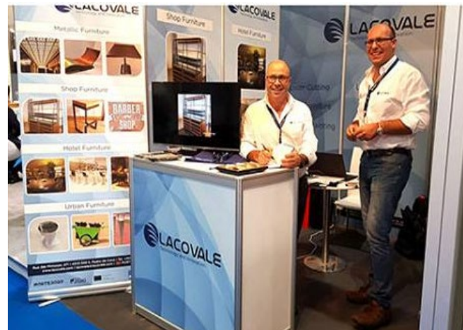
Big Five 2016

Assim podemos concluir que o projeto foi um fator de sucesso na nossa estratégia de internacionalização, permitindo-nos alargar horizontes, conquistando novos mercados e consequentemente exponenciar as nossas vendas.